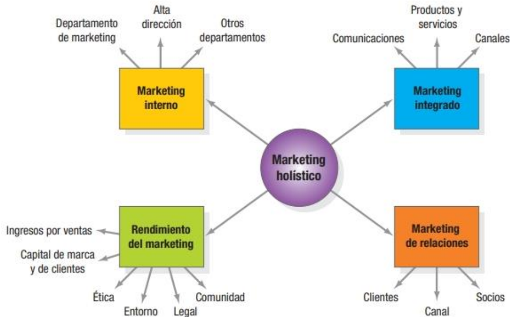
Figura 3. Componentes del marketing holístico. Fuente: Kotler y Keller (2012)

Marketing interno o Endomarketing, está clasificado dentro del marketing holístico, consiste en la tarea de contratar, capacitar y motivar a los empleados de la organización en la atención de los usuarios, estos deben estar identificados con los valores y objetivos de las instituciones donde laboran, los miembros de la alta dirección adoptan los principios adecuados del marketing y dan un trato de clientes internos a los empleados. En consecuencia, existe un reconocimiento por parte de los especialistas en marketing de la importancia del personal, ya que, al sentirse valorados, brindan un mejor servicio (Gutiérrez, 2022).