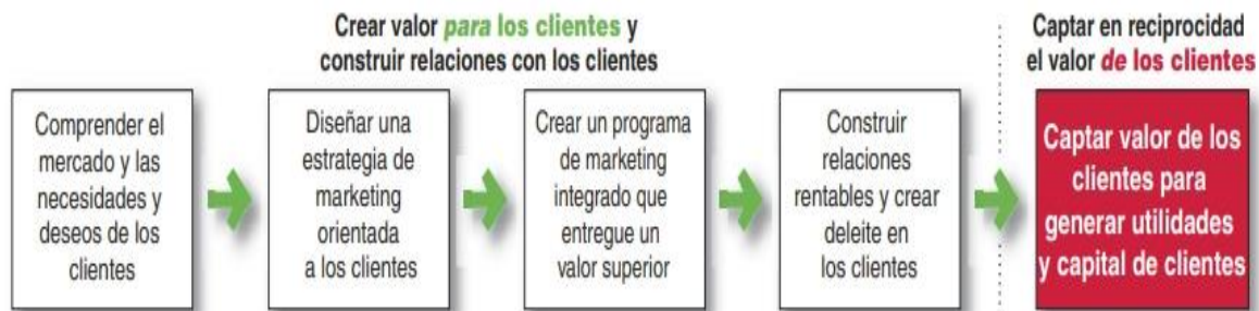
Figura 1. Proceso de Marketing

En la Figura 1 se evidencia en pasos sencillos el proceso del marketing, teniendo como principal propósito comprender la interacción de los elementos que intervienen en él; es decir; que las empresas crean valor para sus clientes y generan fuertes relaciones con ellos para en reciprocidad, captar el valor de sus clientes (Kotler et al., 2014).