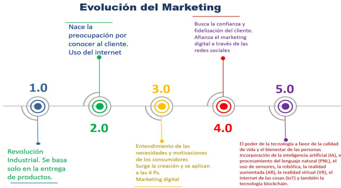
Figura 2. Evolución del marketing.

A lo que, Lozano et al. (2021), plantea que, la forma de hacer marketing ha ido cambiando, adaptándose a los cambios tecnológicos, económicos, financieros y sociales, que han ido evolucionando; así mismo considera que la evolución del Marketing, se ha ajustado a los constantes cambios de las tecnologías, en consecuencia, se debe innovar. En la figura dos se puede apreciar la evolución del marketing digital que va desde el 1.0 con la revolución industrial donde no se toma en cuenta el cliente, haciendo énfasis solo en la entrega de los productos que se producían en serie y a bajo costo, hasta llegar a la etapa actual llamada 5.0, donde el uso de Tics, IA, robótica, realidad aumentada, redes sociales, actúan para no solo dar a conocer una organización o producto; sino que también operan para cambiar el rumbo del marketing y estar a disposición de satisfacer las necesidades del cliente, (Gómez y Tauro 2023).